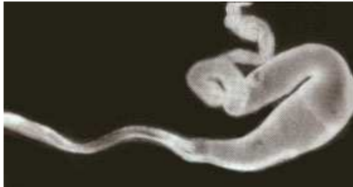
Рисунок 2. Шелковая железа, выделяющая «канатный» шелк

Q24.1. (1 балл) Канатный шелк образуется самой большой шелковой железой этого паука (Рисунок 2). Найдите самую большую шелковую железу и внесите код из Таблицы 4 в лист ответов.